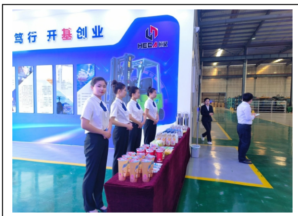
图 2-8 县政府督查颁奖