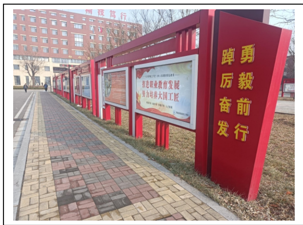
图 4-5 校园宣传栏：大力发展职业教育