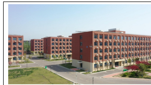
图 1-6 学校公寓