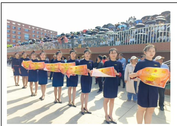
图 2-7 学校演讲比赛颁奖