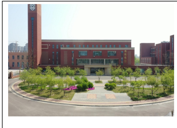
图 1-4 学校公共实训基地