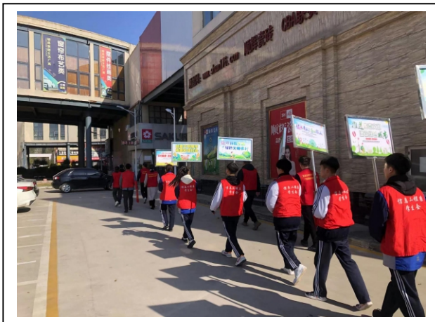
图 4-7 共建绿色家园 1