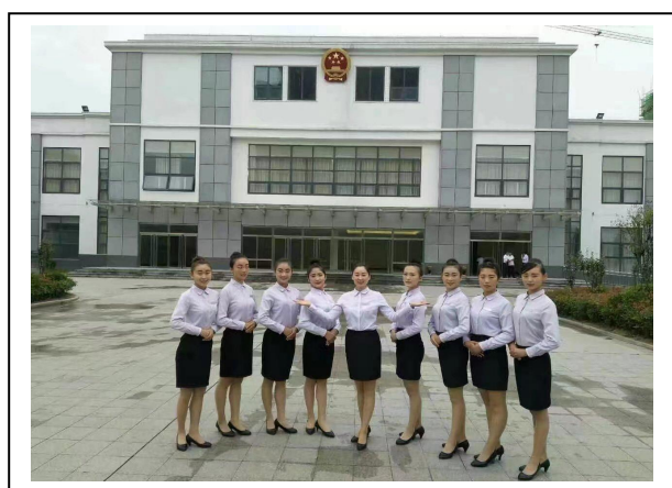
图 2-10 教师节表彰颁奖