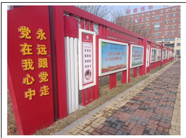
图 4-4 校园宣传栏：社会主义核心价值观