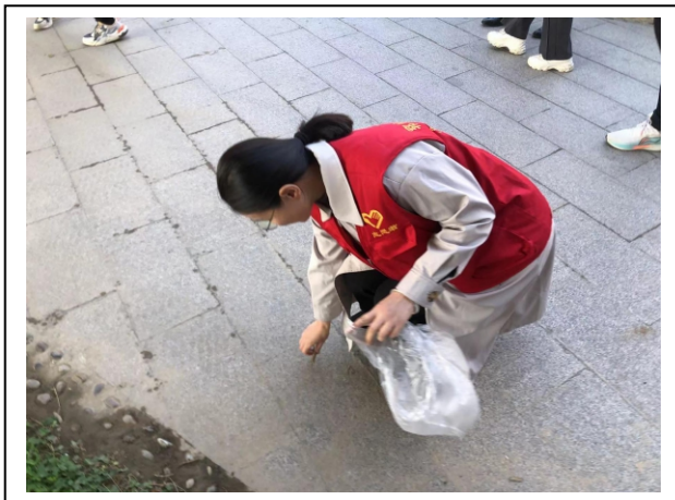
图 4-8 共建绿色家园 2