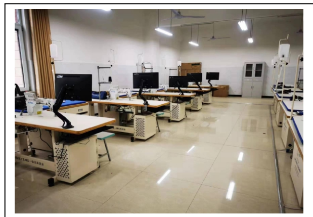
图 1-8 理实一体化室