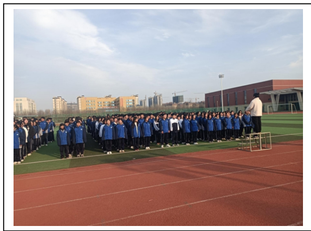
图 4-6 课外活动学生训练唱国歌