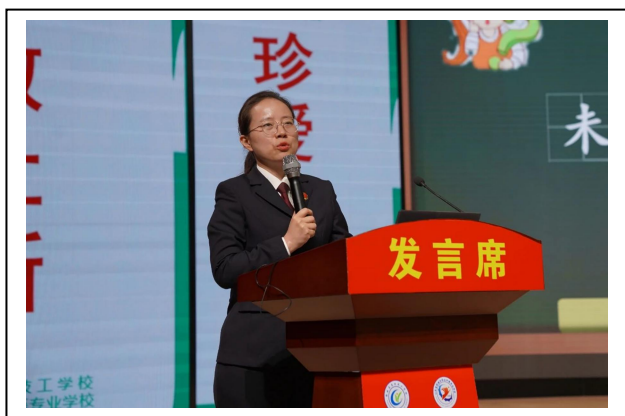
图 7-3 零欺凌活动 1

本次宣讲活动让学生对校园欺凌有了新的认识，提高了抵制和防范校园欺凌的能力。今后，我校将继续教育引导树立正确的价值观、提高处事能力，不断增强学生安全意识和自我保护能力，共同打造平安和谐文明的校园环境。