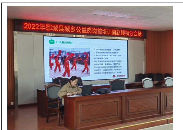
图 3-1 农村公益岗理论培训

通过公益岗培训，提供给乡村困难人群、残疾人士就业，不仅解决了环境卫生问题、公益服务问题，也改善了社会矛盾，提升了社会治安综合治理。