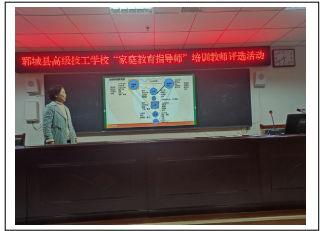
图 4-2 家庭教育指导师评选 2