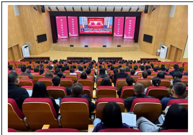
图 2-1 任课教师观看二十大直播盛况