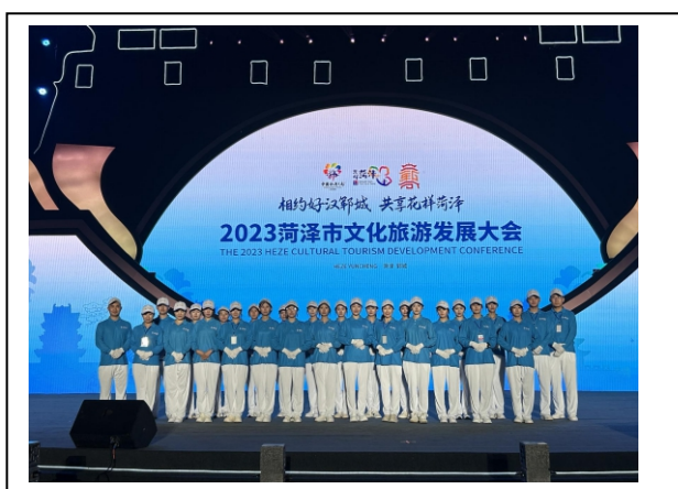
图 2-9 文化旅游发展会颁奖