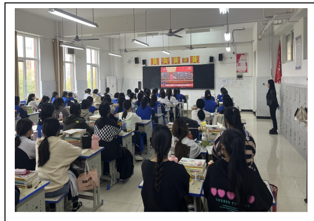
图 2-2 学生观看二十大盛况