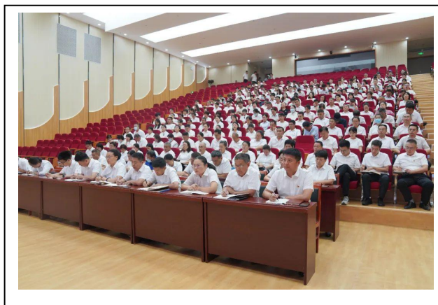
图 7-2 教学工作会议 2