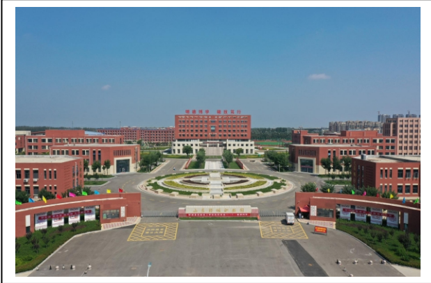
图 1-1 学校鸟瞰图