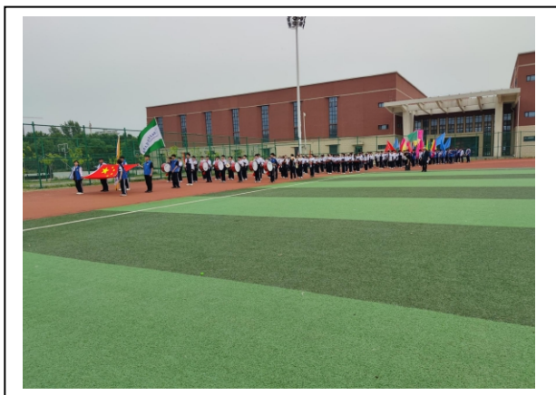
图 2-3 军乐队训练队形