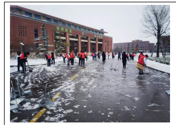
图 2-6 学生志愿者清扫积雪