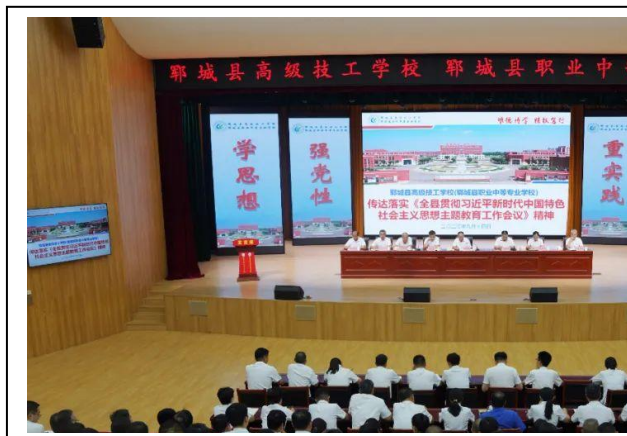
图 7-1 教学工作会议 1

坚决担负起推动我校职业教育创新高质量发展的使命与责任，为我校打造职业教育创新发展高地做出新的贡献。