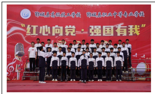
图 4-10 庆七一歌咏比赛 2