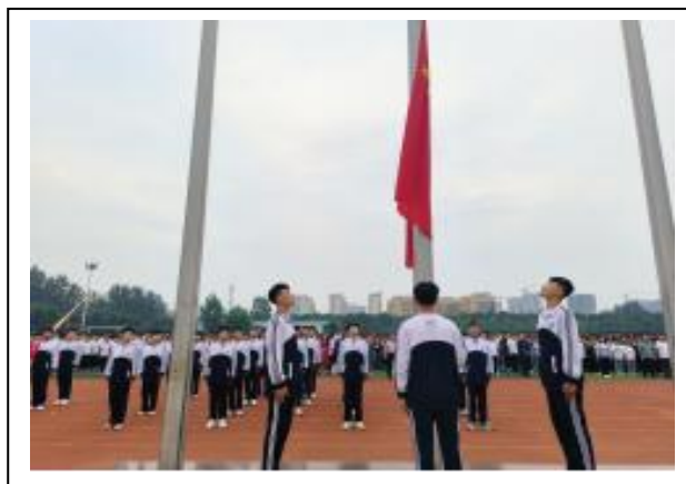
图 2-4 升旗仪式