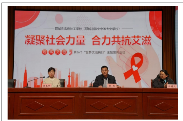
图 7-5 合力共抗艾滋 1

此次校园宣讲活动，让学生们认识到什么是艾滋病，对“性”有了正确的理解，有效促进学生们形成正确的恋爱观和道德观，为学生的健康成长加油助力。下一步，我校将进一步团结社会各界力量，为学生的全面健康成长保驾护航。