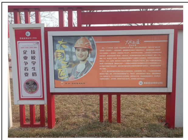
图 4-3 校园宣传栏：大国工匠