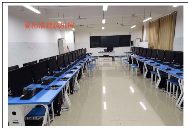
图 1-9 微机室