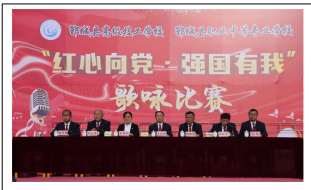
图 4-9 庆七一歌咏比赛 1

为庆祝中国共产党成立102周年，丰富校园文化生活，努力营造积极向上，和谐健康的校园文化氛围，弘扬当代爱国精神。6月29日，我校举办了庆七一“红心向党、强国有我”歌咏比赛。本次活动的主要目的在于弘扬爱国主义精神，激发青年学生的爱国热情和创造力，促进学生良好的思想道德品质和实践能力的全面提升。同时，通过歌声传递爱国感情，继承和发扬红色传统，激发全体师生争创中华民族伟大复兴的激情与决心。