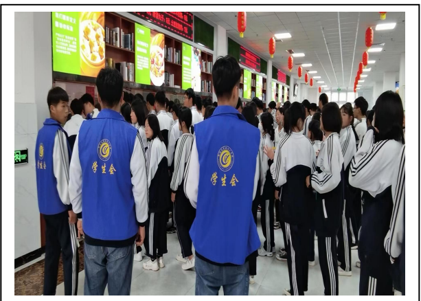
图 2-5 学生会维持就餐秩序