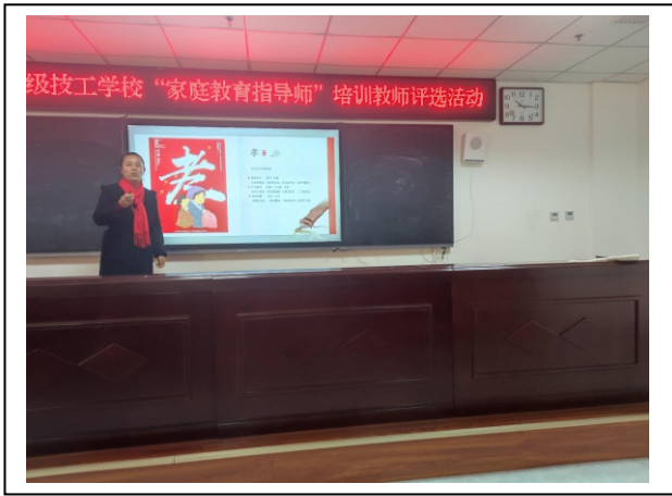
图 4-1 家庭教育指导师评选 1