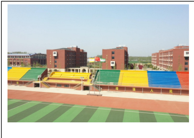
图 1-3 学校运动场