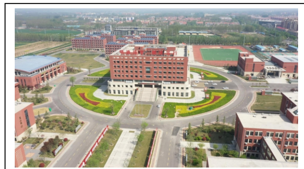
图 1-5 学校办公楼