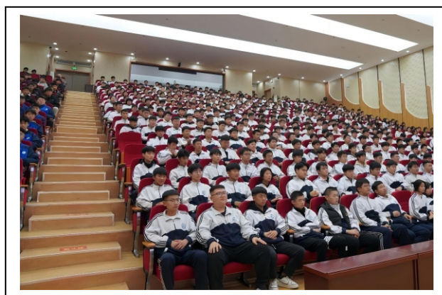
图 7-6 合力共抗艾滋 2