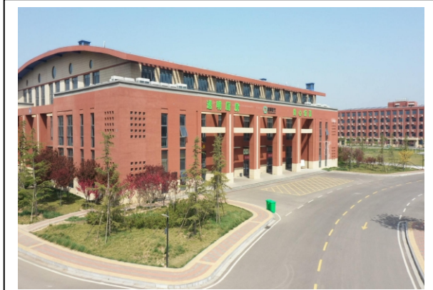
图 1-2 学校餐厅