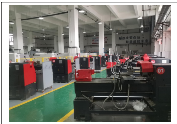
图 1-7 实训车间